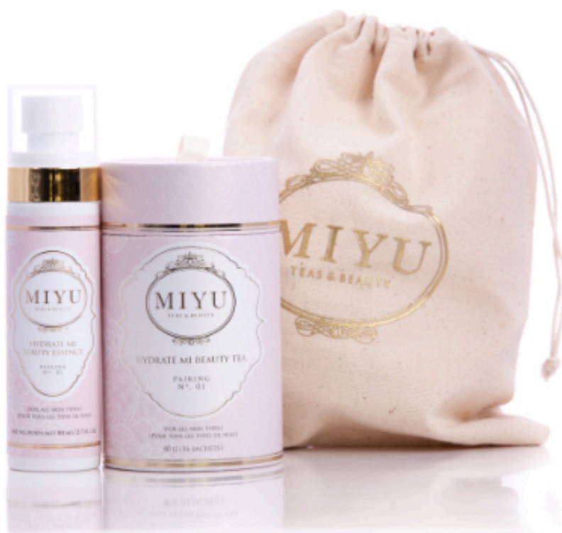
Hydrate Mi (duo no1), Miyu, 34 $ les 80 ml de brume hydratante et 16 $ la boîte de 16 sachets de thé

La marque canadienne Miyu s'est inspirée d'une tendance très populaire en Asie pour concocter des duos beauté associant des «essences de beauté» – sortes d'hybride entre la brume faciale et le sérum – à des thés artisanaux. Durant le dernier mois, j'ai testé l'ensemble Hydrate Mi, parfait pour atténuer les effets asséchants des écarts de température. Le sérum à base de rose, de pensée sauvage et de baie de goji hydrate et tonifie l'épiderme juste avant l'application d'une bonne crème, tandis que le thé associé (un rooibos vert aromatisé aux baies de goji, pétales de rose et poire) se boit chaud ou froid pour un surcroît d'hydratation bienvenu. Le concept est si rafraîchissant qu'on pardonne aisément la traduction hasardeuse («Pour une peau nappée de rosée», peut-on lire entre autres) sur certains emballages, par ailleurs fort jolis.