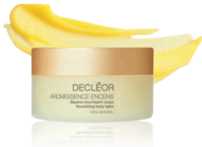
Baume nourrissant corps, Decléor, 69 $